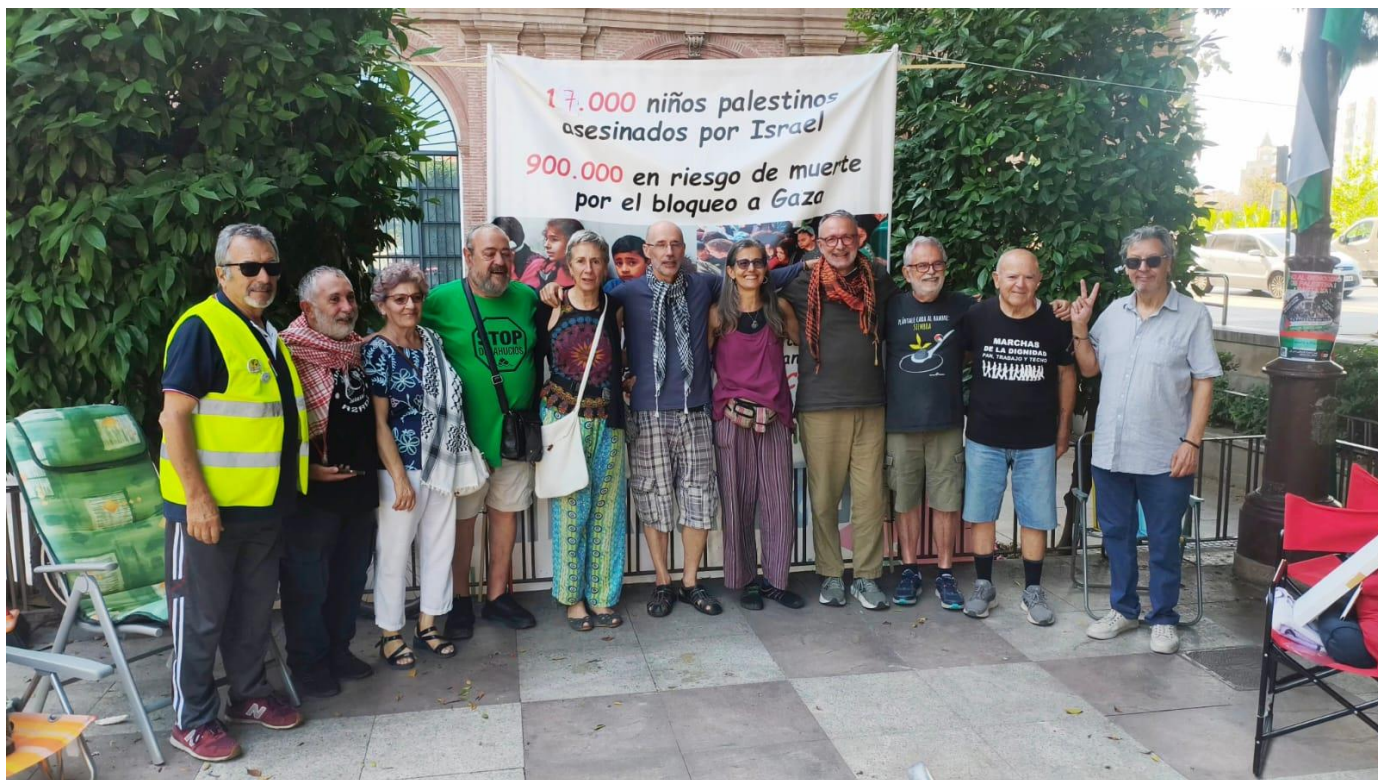
Grupo saliente del día 5 y grupo entrante del día 6. Viva Palestina Libre.

Muy positivamente. Con esta huelga de hambre hemos conseguido despertar algunas conciencias que estaban dormidas. Ha tenido una gran repercusión mediática y hemos logrado llegar a toda la sociedad murciana. Incluso ha traspasado los límites geográficos de nuestra comunidad. La huelga durará 17 días, en turnos de 24 horas, con equipos de cinco personas que se relevan. Por eso decimos que es intermitente en los huelguistas, pero permanente en el tiempo.